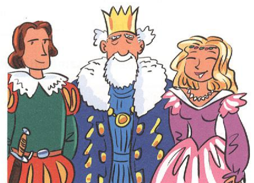
der Prinz, der König und die Prinzessin